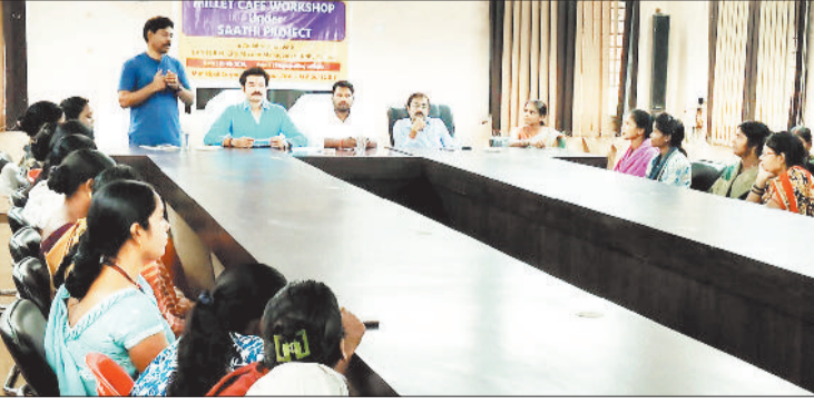
कार्यशाला में नपा के पदाधिकारियों के साथ उपस्थित महिलाएं।

नगर पालिका परिषद द्वारा महिलाओं को आत्मनिर्भर बनाने एवं स्वरोजगार से जोड़ने के उद्देश्य से डे-एनयूएलएम और साथी परियोजना के संयुक्त तत्वावधान में मिलेट कैफे संचालन हेतु एक दिवसीय कार्यशाला का आयोजन किया गया। यह कार्यशाला नगर पालिका सभाकक्ष में आयोजित की गई, जिसमें शहर के विभिन्न वार्डों से लगभग 60 स्व-सहायता समूह की महिलाएं एवं 12 शहरी पथ विक्रेता शामिल हुए।