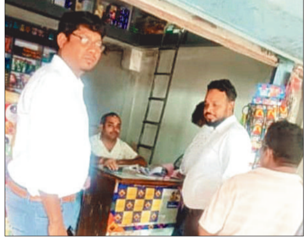
दुकानों में कार्रवाई करती खाद्य एवं औषधि प्रशासन विभाग।

जशापुरनगर। खाद्य एवं औषधि प्रशासन के नियंत्रक विभाग के निर्देशानुसार कोटपा एक्ट 2003 के तहत जिले में कार्यवाही किया जा रहा है। कोटपा एक्ट 2003 तहत किसी भी स्कूल के 100 गज के भीतर संचालित दुकानें जिसमें तम्बाकू उत्पाद विक्रय कर रहे हैं, उन पर कोटपा एक्ट के तहत कार्रवाई की गई है।