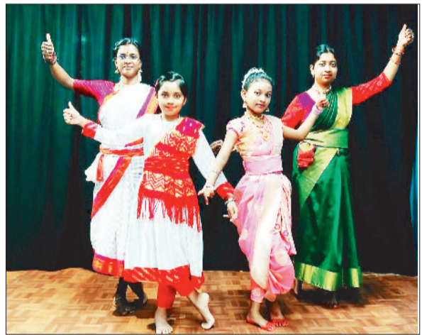
समापन मौके पर नृत्य प्रस्तुत करती छात्राएं।

कार्यशाला में छात्रों को शास्त्रीय नृत्य की मुद्राओं, आसन, भाव आदि का प्रशिक्षण दिया गया साथ ही समापन के अवसर पर प्रस्तुति का आयोजन भी किया जिसमें प्रशिक्षणार्थियों और प्रशिक्षक दोनों ने मिलकर भरतनाट्यम नृत्य पर आधारित प्रस्तुति दी। प्रशिक्षण में मुख्य रूप से शास्त्रीय नृत्य के मुद्रा गतियों, भाव, आसन और सुन्नियों को बतलाया गया। गोस्वामी तुलसीदास जी द्वारा रचित 'श्री रामचंद्र कृपालु भजन मन' भजन पर सभी ने मनमोहक प्रस्तुति दी, भरतनाट्यम में दक्षिण भारतीय पदों के गायन के साथ ही नृत्य की प्रस्तुति होती है पर शुरू में थोड़ा