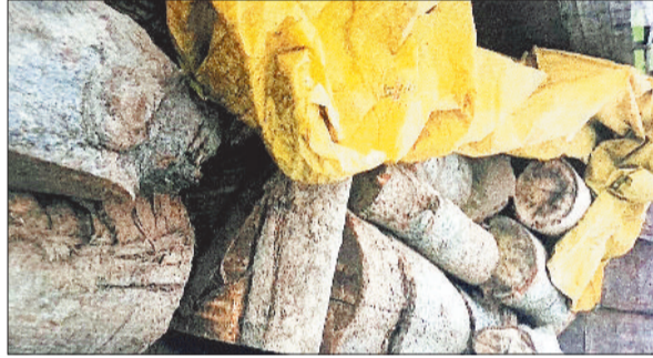
ट्रक में लोड लकड़ी।

वनमण्डलाधिकारी से मिली जानकारी के अनुसार परिक्षेत्राधिकारी मनोरा द्वारा मनोरा परिक्षेत्र के परिसर ओरडीह के निरीक्षण के दौरान प्राप्त तलवारों के पास टाटा ट्रक वाहन क्रमांक सीजी 15 सीडब्लू 3791 में सेमल लकड़ी लोड देखकर संदेह के आधार पर पूछताछ किया गया।